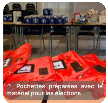
↑ Pochettes préparées avec le matériel pour les élections

et préparé dans une pochette, pour chacun des quinze bureaux de vote de la ville.