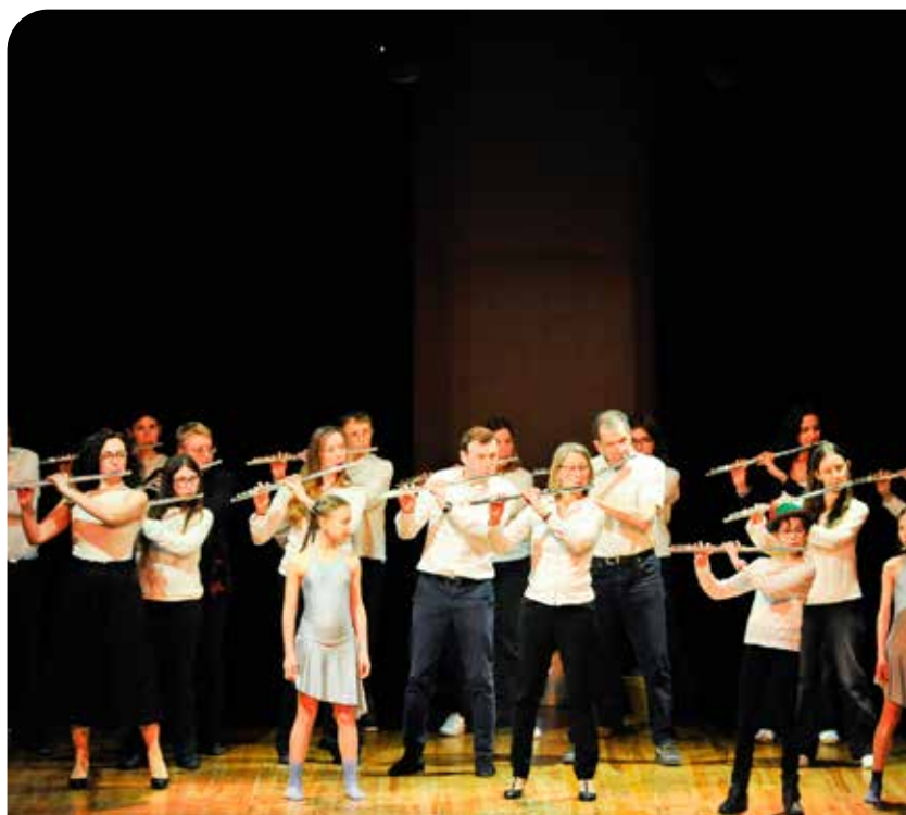
↑ Vendredi 20 février, les élèves des classes de danse contemporaine du Conservatoire Municipal de Danse et l'ensemble de flûtes traversières de Marne et Gondoire ont offert un très beau spectacle, basé sur «Le Joueur de flûte de Hamelin».