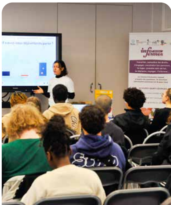
↑ La cérémonie des jeunes majeurs s'est déroulée le samedi 7 février. Organisée par la Structure Information Jeunesse, elle a accueilli une cinquantaine de jeunes Buxangeorgiens, qui ont reçu, à l'issue de cette cérémonie, leur carte électorale.