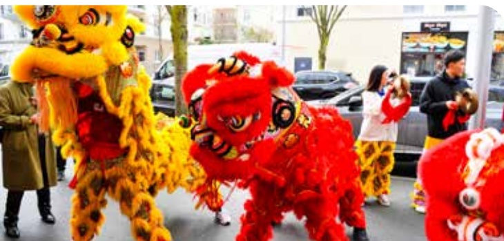
↑ Samedi 21 février, la ville a vibré au rythme des tambours et cymbales à l'occasion de la traditionnelle danse des lions, orchestrée par les jeunes artistes de l'association BLIA YAD Paris.