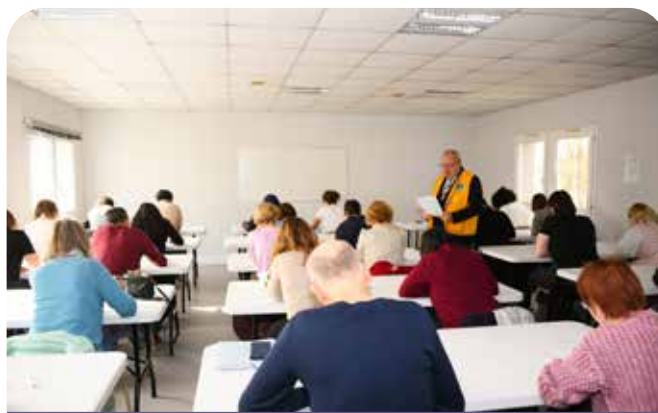
↑ La Maison d'Afrique de Bussy, en collaboration avec le Lions Club, a quant à elle proposé une dictée à laquelle ont pris part une trentaine d'amoureux de l'orthographe.