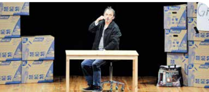
↑ Couronné d'un Molière du meilleur seul en scène en 2008, Eric Métayer est reparti en tournée avec Un Monde fou . Une tournée qui faisait étape salle Maurice-Koehl le samedi 7 février, pour le plus grand plaisir du public buxangeorgien.