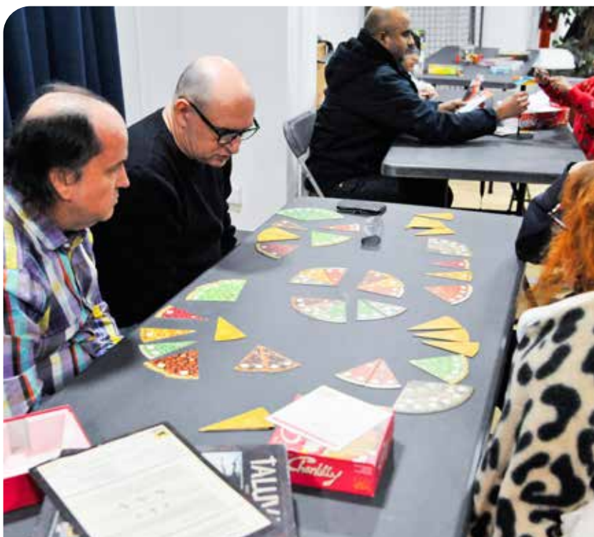
↑ Nouvelle soirée jeux organisée par la ludothèque le samedi 14 février, avec en cette Saint-Valentin les coups de cœur des équipes de la ludothèque et de l'association Le Renard Enjôlé.