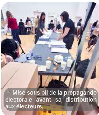
↑ Mise sous pli de la propagande électorale avant sa distribution aux électeurs.

Pour garantir la conformité des procédures, les agents du service Affaires Civiles, ainsi que les secrétaires de bureau suivent des formations et des rappels réglementaires portant sur la législation électorale et ses éventuelles évolutions.