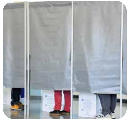
↑ Passage par l'isoloir avant de glisser l'enveloppe contenant le bulletin de vote dans l'urne.