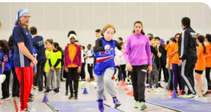
↑ Les Poussinades du BSGA, axées sur la découverte de l'athlétisme (course, sauts, lancers) ont accueilli de nombreux athlètes en herbe souhaitant découvrir toutes ces disciplines, dans une très belle ambiance, samedi 7 février, au complexe sportif Laura-Flessel.